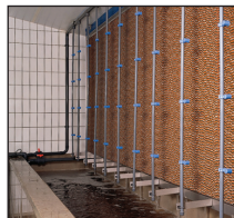
Magix Lavage d'air