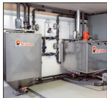
HydroMix Alimentation Liquide