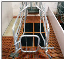
Case de Mise Bas avec Caillebotis gommé »SowComfort«